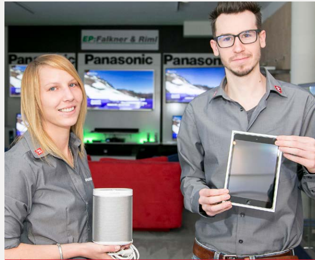
Unsere Mitarbeiter von der Filiale Imst kennen sich aus in Sachen Smart-TVs, Sonos-Lautsprechern oder iPad.